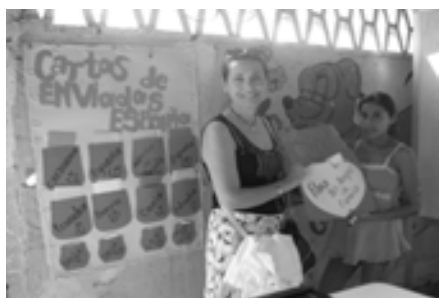
Entrega de cartas para España en Manantial de Colonche

Mientras tanto, por la tarde, la visita a los CAEDINNAS con los que nos hallamos vinculados continuaba en Manantial de Colonche, a donde tres recreadores atienden a 70 niños y niñas en dos naves diferentes, una cedida por la parroquia para el desarrollo de talleres para jóvenes, que durante un tiempo reciben de facilitadores a través de ayuda gubernamental. Pero si no es así, reciben atención de los recreadores del centro de apoyo. Precisamente, de allí fueron las chicas que realizaron nuestra entrevista; pero se nos olvidó preguntarles sus nombres.