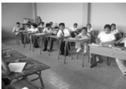
Visita al Colegio José M o Chávez Mata