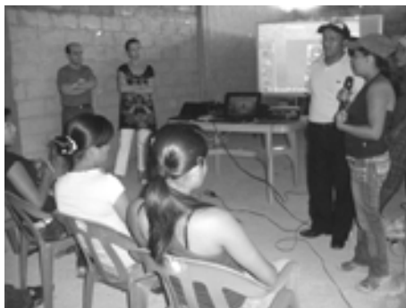
Presentación en el CAEDINNA de Río Seco