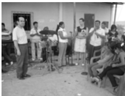
Palabras de bienvenida en el CAEDINNA de Febres Cordero.