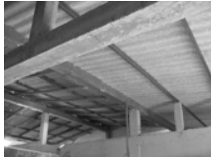
Mejora del techo de Bambil Collao gracias a los aportaciones dalienses

Asimismo, durante el fin de semana, los profesores pudieron visitar varias fincas dedicadas a distintos cultivos y plantaciones (cacao, bananas, café, caoba, sandía, melón, pepino, tomate, . . .), la preparación de la paja toquilla para su empleo artesanal, y la elaboración de numerosos artículos, como pulseras, sombreros, cestas, . . . en empresas creadas por y para mujeres.